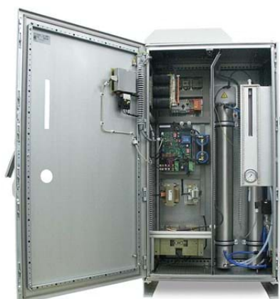
Вид изнутри: генератор GSO 50 (слева) и GSO 10-30