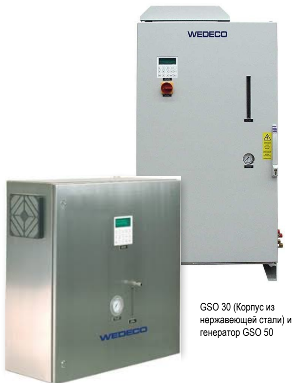
GSO 30 (Корпус из нержавеющей стали) и генератор GSO 50